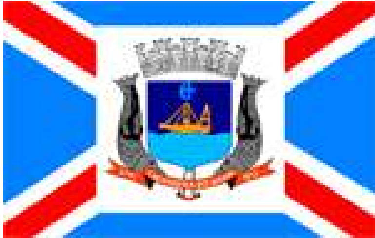
Bandeira de Cachoeira do Arari