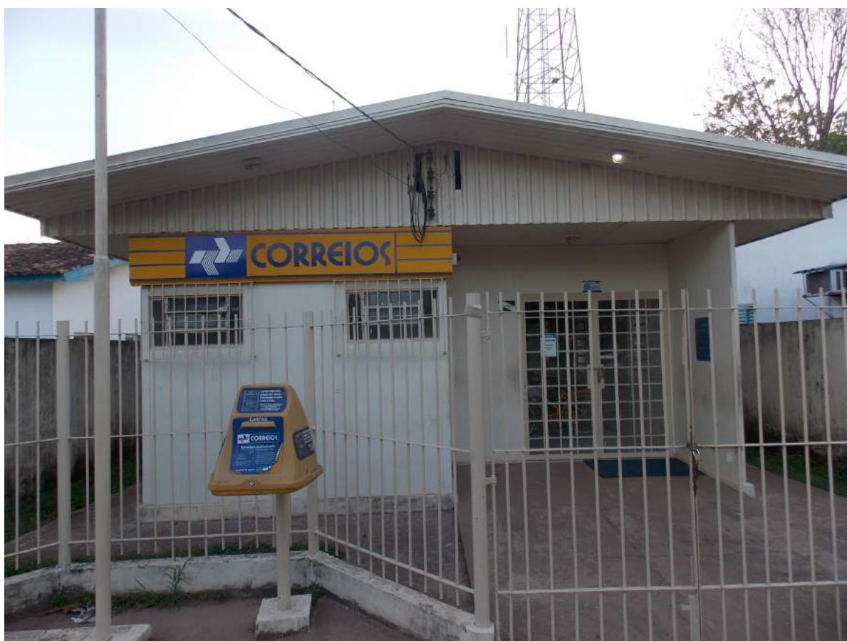
Figura 1: Agência Postal

Abrangência/circulação/cobertura: Municipal.