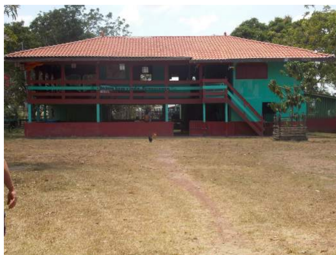
Figura 9: Fazenda Renascença

Atividades desenvolvidas: Produção e comercialização de queijo e leite de búfala e venda de gado.