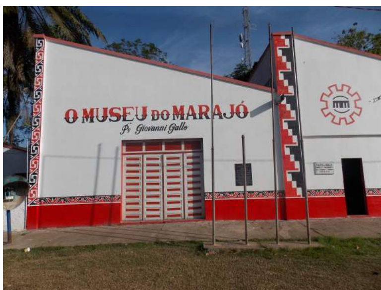
Figura 6: Museu do Marajó

Acessibilidade: Não possui alguma facilidade para pessoas com deficiência ou mobilidade reduzida.