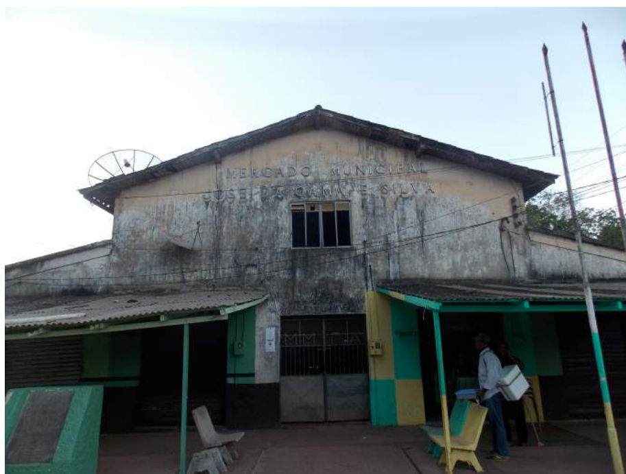
Figura 3: Mercado Municipal

Acessibilidade: Não possui facilidade de acesso para pessoas com deficiência ou mobilidade reduzida.