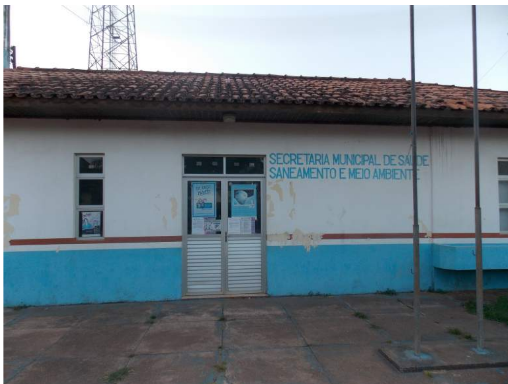
Figura 2: Secretaria de Saúde

Em relação ao Sistema de Saúde, a população conta com os serviços prestados pela Unidade Mista de Cachoeira, que se encontra localizado à Av. Dep. José Rodrigues Viana, s/n. Dirigida pelo município e funcionando durante 24 horas, oferece à população serviços de atendimento médico/odontológico/ambulatorial e obstetrícia (parto normal).