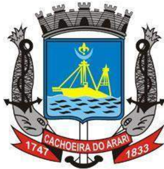
Brasão de Cachoeira do Arari