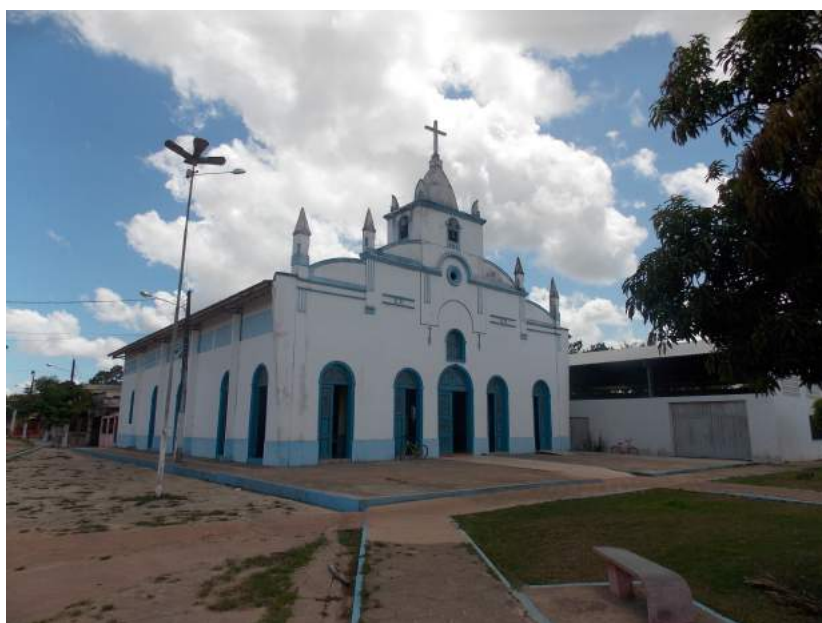
Figura 5: Igreja de N. S. Conceição

Acessibilidade: Não possui facilidade para pessoas com deficiência ou mobilidade reduzida.