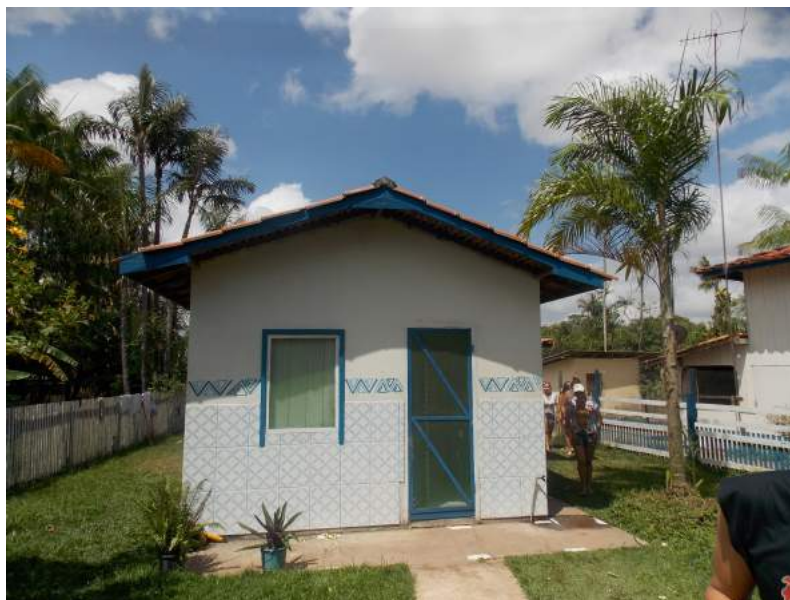
Figura 8: Queijaria

Atividades desenvolvidas: Produção de queijo e doce de leite.