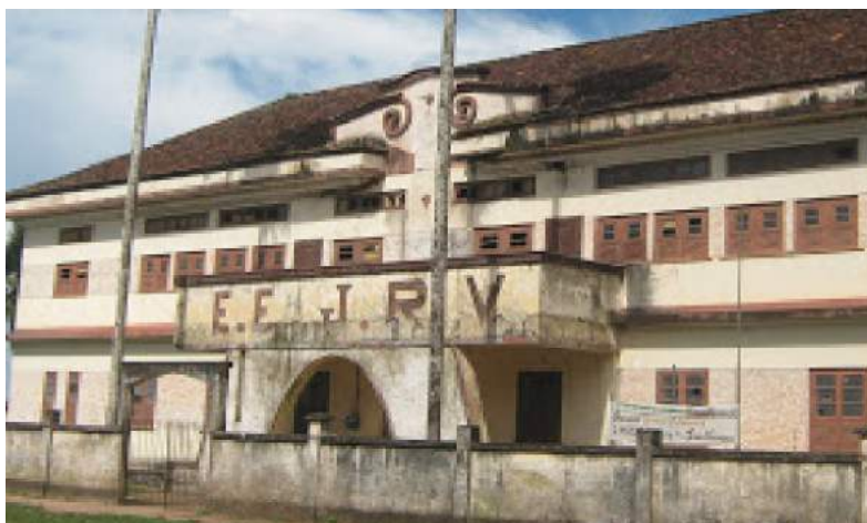
Figura 5: Antigo Internato