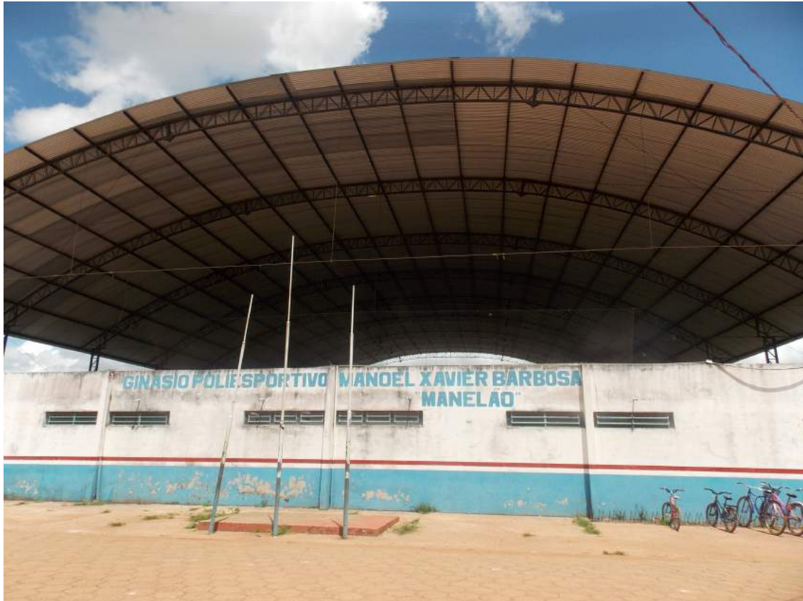
Figura 4: Ginásio Poliesportivo