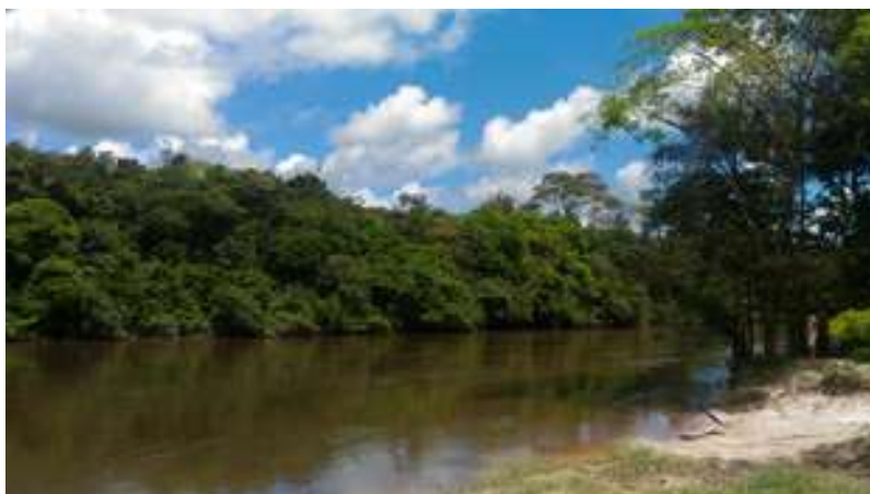
Figura 24: Comunidade Muruteuazinho - Rio Guamá

Acessibilidade para pessoas com deficiência ou mobilidade reduzida: Não.