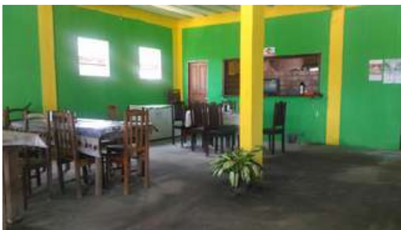
Figura 11: Restaurante Fé em Deus

Possui acessibilidade para pessoas com deficiência ou mobilidade reduzida: Não.