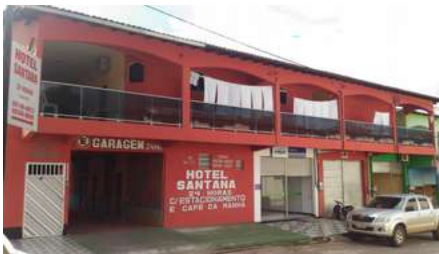
Figura 6: Hotel Santana