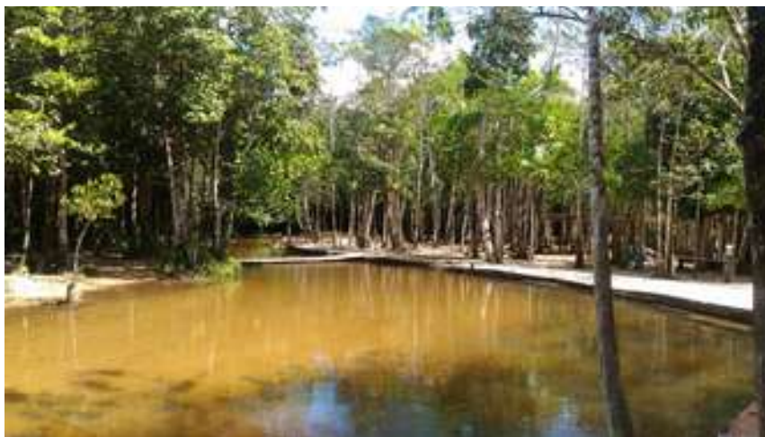
Figura 20: Balneário Barreirinha

Acessibilidade para pessoas com deficiência ou mobilidade reduzida: Não.