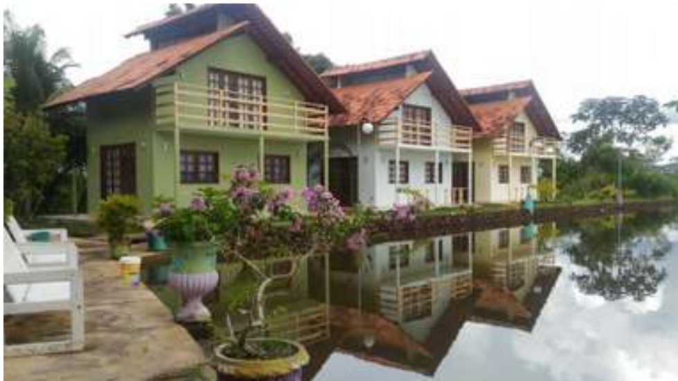
Figura 5: Hotel Fazenda Santa Luzia Rural

Serviços: Aluguel de espaço para terceiros, serviços de alimentação, serviços de som, copa, ar-condicionado central, projetor, computador, internet sem fio, sonorização, elevador, aluguel de cadeiras e decoração.