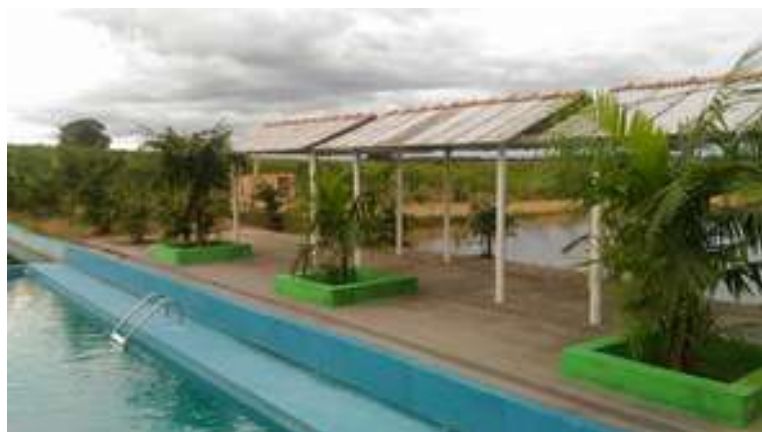
Figura 18: Balneário Encantos

Acessibilidade para pessoas com deficiência ou mobilidade reduzida: Não.