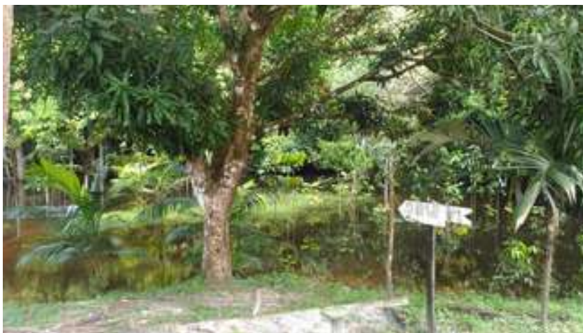
Figura 19: Balneário Recantinho do Sossego