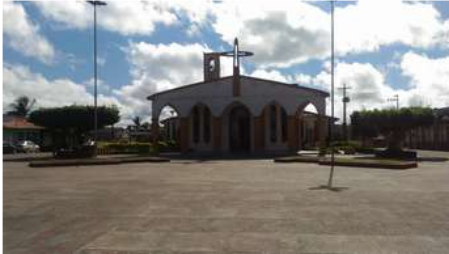
Figura 13: Praça da Igreja Matriz