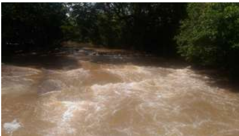
Figura 23: Cachoeirinha do Pau D'arco

Acessibilidade para pessoas com deficiência ou mobilidade reduzida: Não.