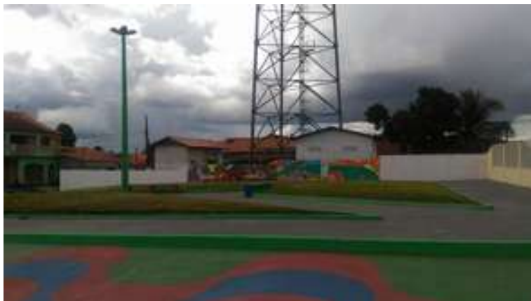
Figura 14: Praça da Câmara Municipal