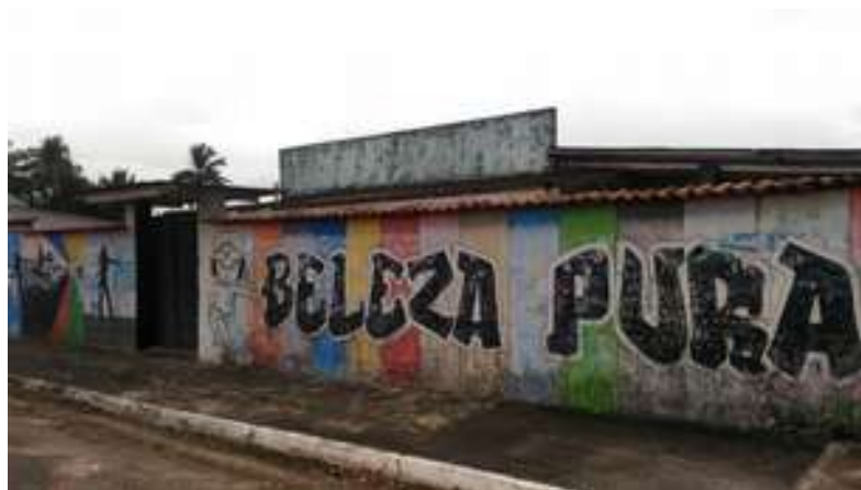
Figura 17: Casa de Shows Beleza Pura

Possui acessibilidade para pessoas com deficiência ou mobilidade reduzida: Não.