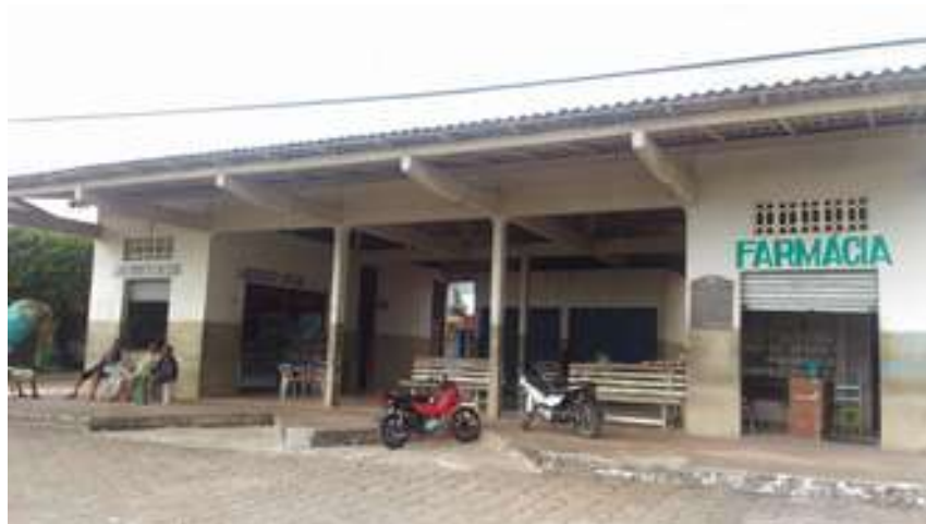
Figura 2: Terminal Rodoviário Antônio Alves da Silva

Possui acessibilidade para pessoas com deficiência ou mobilidade reduzida: Não.