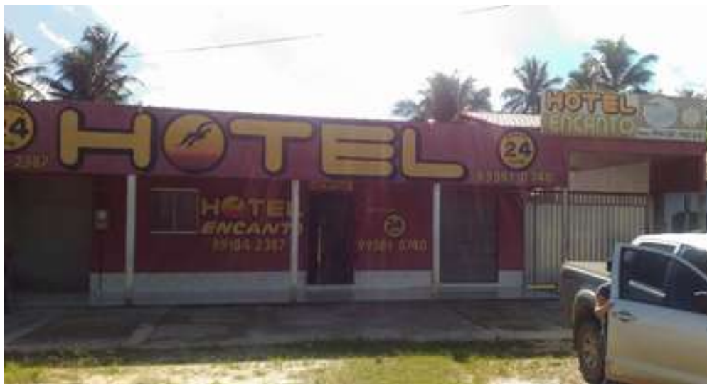
Figura 4: Hotel Encanto