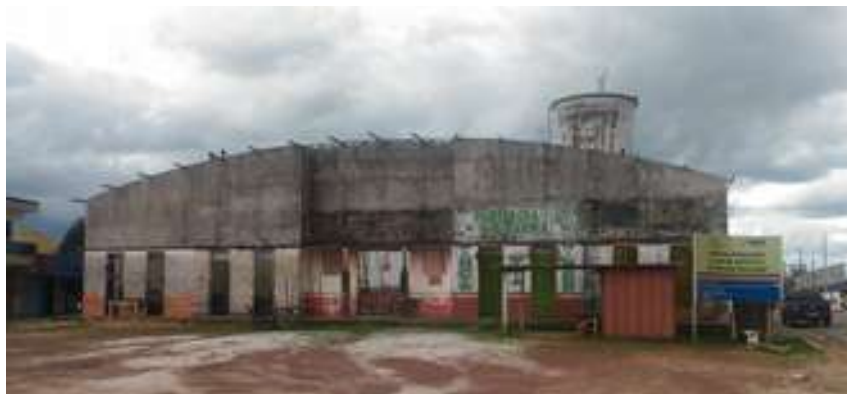
Figura 3: Mercado Municipal de Santa Luzia

Observações: Encontra-se em obras com previsão de conclusão no segundo semestre de 2017, segundo fonte da Prefeitura municipal.