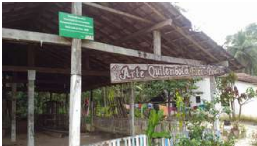
Figura 26: Comunidade Remanescentes de Quilombo do Jacareaquara.