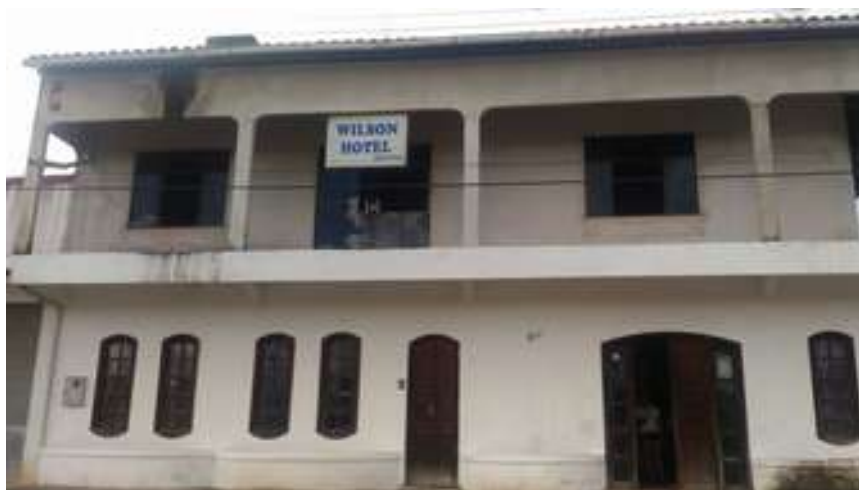
Figura 8: Wilson Hotel

Acessibilidade para pessoas com deficiência ou mobilidade reduzida: Não.