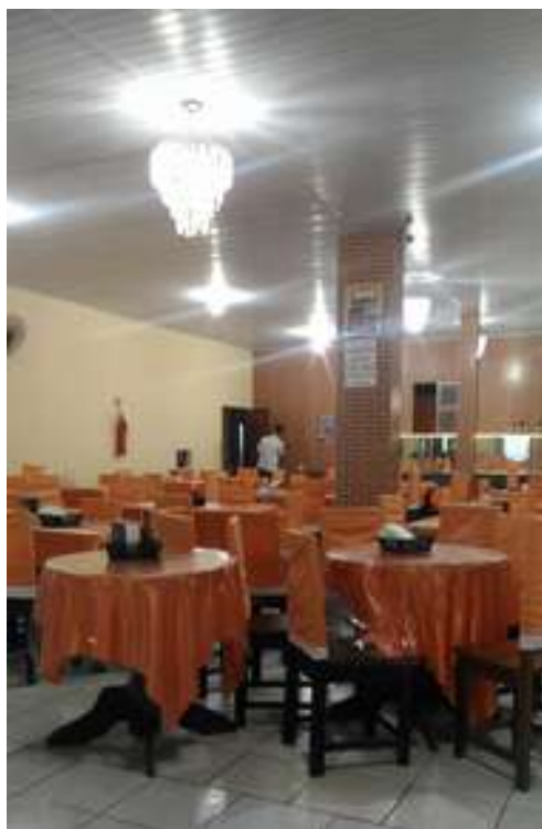
Figura 10: Restaurante e Lanchonete Fênix