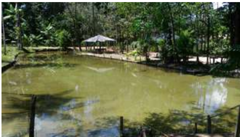
Figura 21: Balneário do Valdecir