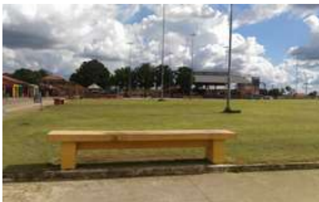
Figura 16: Praça Lucas Cavalcante de Lima - Espaço utilizado para eventos