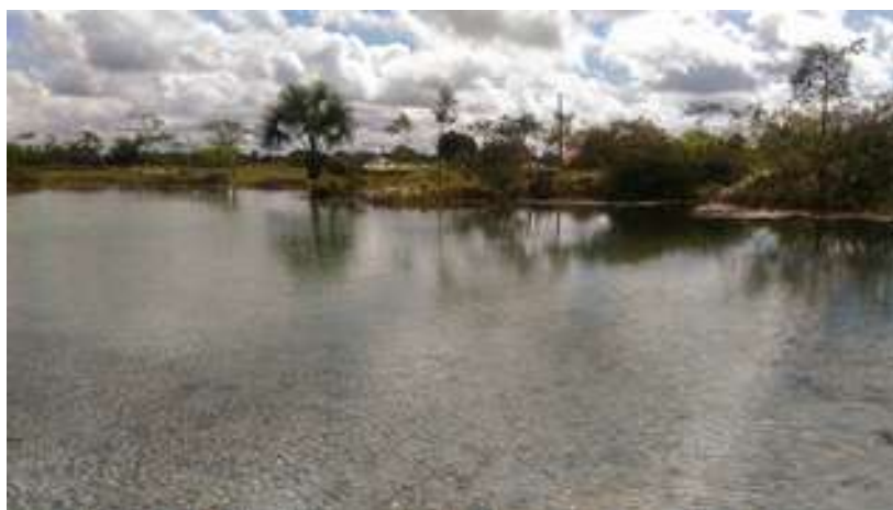
Figura 22: Balneário Lagoa Azul

Acessibilidade para pessoas com deficiência ou mobilidade reduzida: Não.