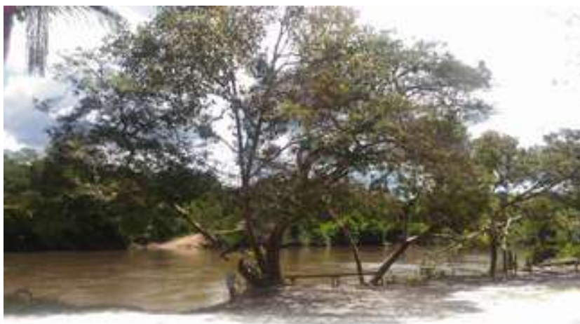
Figura 25: Comunidade Jacareaquara - Rio Guamá

Acessibilidade para pessoas com deficiência ou mobilidade reduzida: Não.