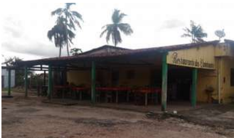
Figura 9: Restaurante dos Caminhoneiros

Possui acessibilidade para pessoas com deficiência ou mobilidade reduzida: Não.