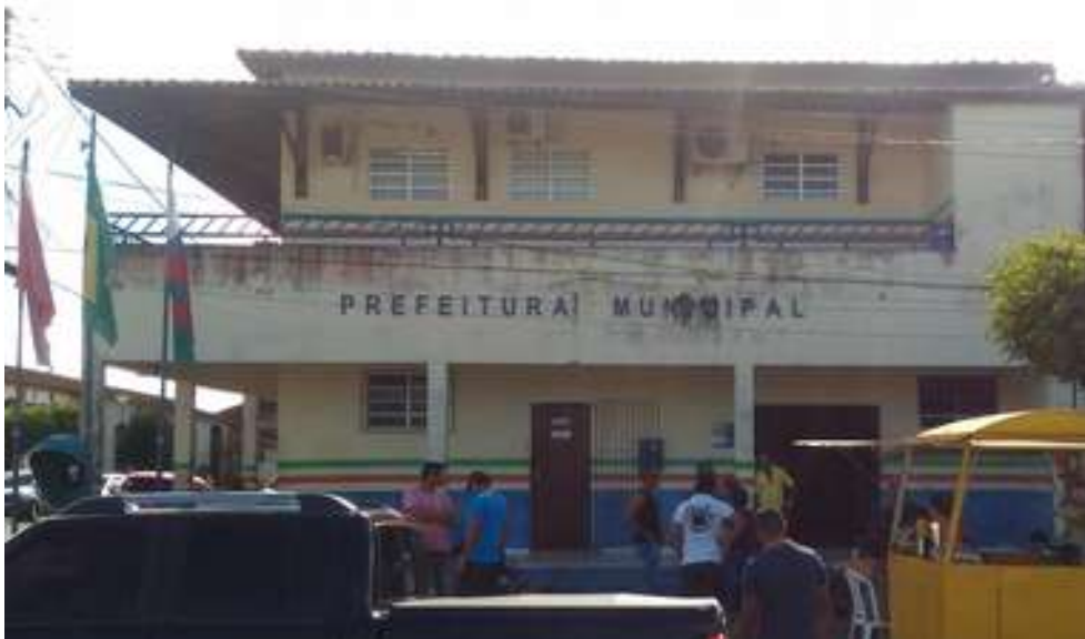
Figura 1: Prefeitura Municipal de Santa Luzia do Pará

Nome do órgão oficial de turismo: Secretária Municipal de Cultura, Esporte, Turismo e Juventude.