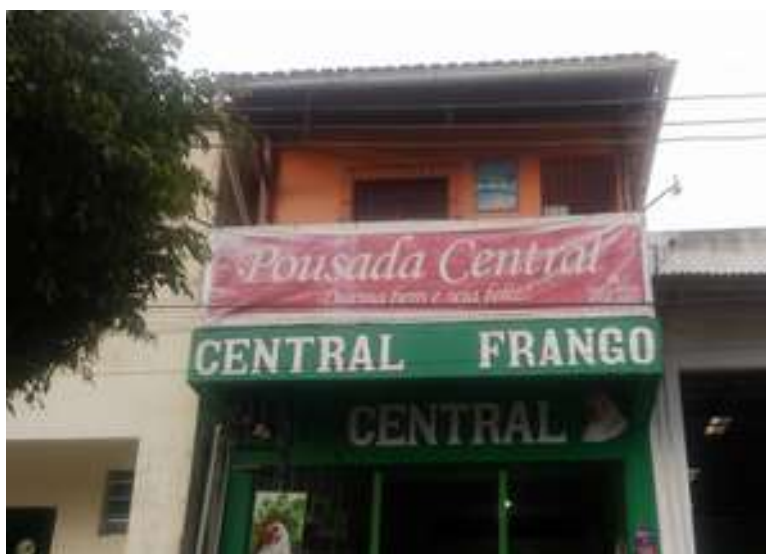
Figura 7: Pousada Central