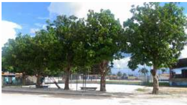
Figura 15: Praça Lucas Cavalcante de Lima - Equipamento de Lazer