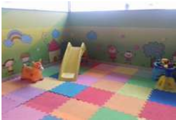
Figura 16: Moju Grill Churracaria (Área infantil)