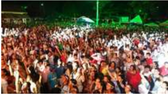
Figura 45: Verão 45° - Balneário do Levi