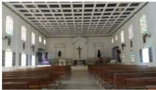
Figura 41: Paróquia do Divino Espírito Santo: Área Interna

Possui acessibilidade para pessoas com deficiência ou mobilidade reduzida: Não