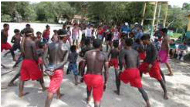
Figura 40: Tribo Anembé

de 1992. Atualmente, há uma escola administrada pela Secretaria de Educação do Município de Moju que funciona como anexo de uma escola do mesmo município, um posto de saúde da SESAI - Secretaria de Saúde Indígena. Após a demarcação da Terra Indígena Anambé, houve a distribuição de famílias em diferentes locais do território, e que eles chamam de “núcleos”, uma reinterpretação da antiga forma de organização em grupos familiares. As decisões de caráter interno e externo são tomadas através de dois caciques e um conselho. Mediante relações de amizade com o pastor da Igreja Evangélica da Vila Elim, a MEIB-Missão Evangélica Índios do Brasil, Secretaria de Educação do Moju, os Anambé tecem suas parcerias que os auxiliam nas articulações com a sociedade mais ampla e no atendimento de suas demandas e saem do âmbito local para o global.