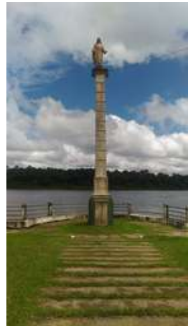
Figura 19: Praça Jarbas Passarinho: Monumento do Divino

Possui acessibilidade para pessoas com deficiência ou mobilidade reduzida: Sim (rampas de acesso).