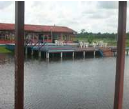
Figura 4: Hotel Fazenda Marajaponga -