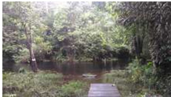
Figura 30: Comunidade Laranjetuba (Iqarapé Grande)