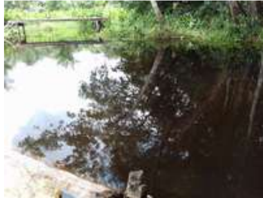
Figura 33: Iqarapé Curupeté