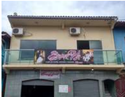
Figura 18: Organizadora de Eventos Espaço Vip