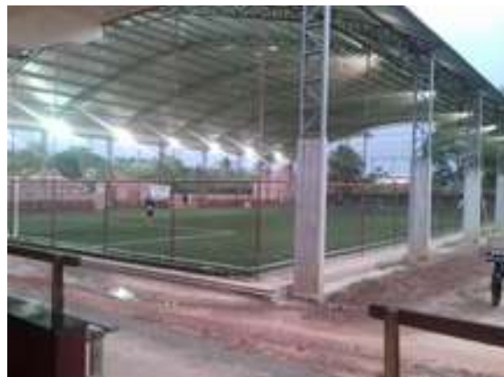
Figura 14: Restaurante Cantinho da Maria (Arena de Futebol)