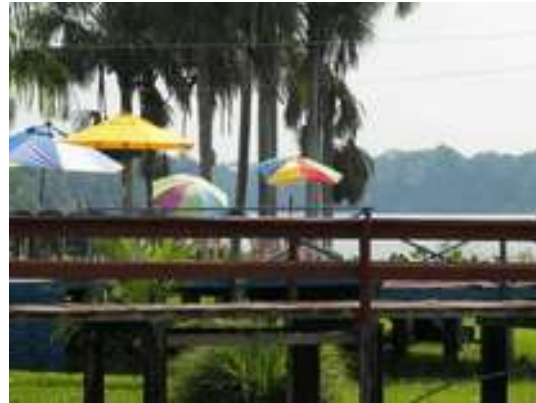
Figura 3: Hotel Fazenda Marajaponga - Área livre