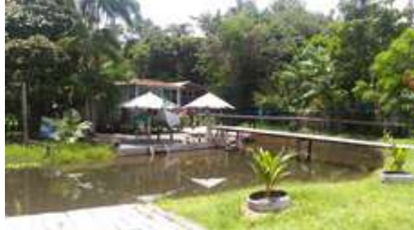
Figura 34: Iqarapé Guarajaúna