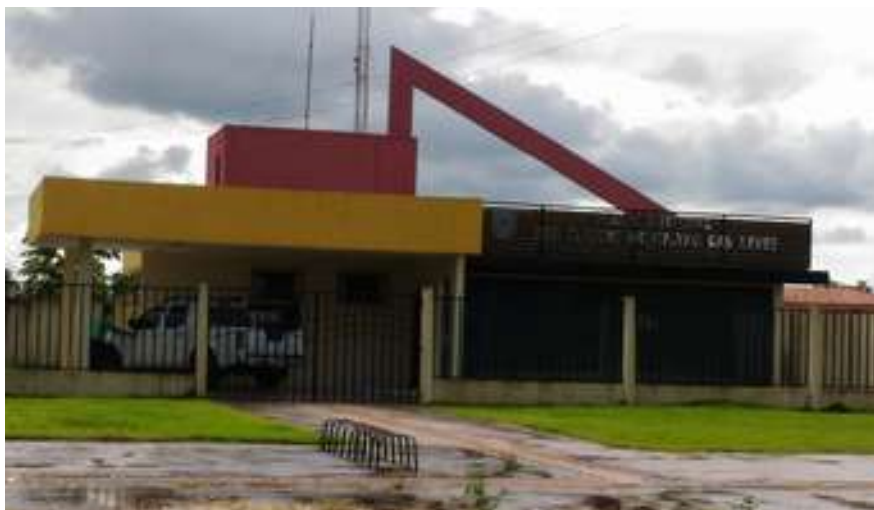
Figura 2: Prédio do Fórum Eleitoral de Moju