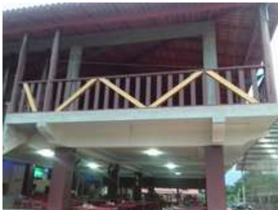
Figura 12: Restaurante Cantinho da Maria (Fachada)

Observação: Possui um campo de futebol society .