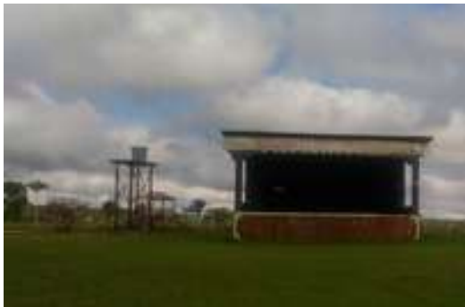
Figura 27: Balneário do Levi: Palco de Shows