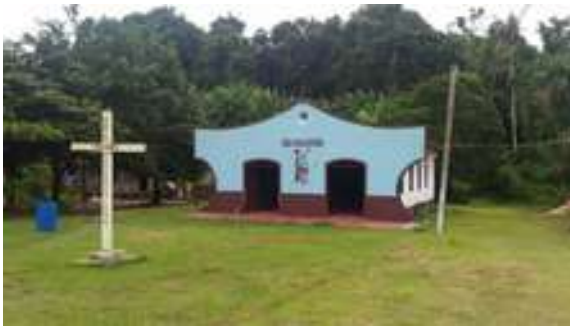
Figura 31: Comunidade Laranjetuba (Igreja de São Sebastião)