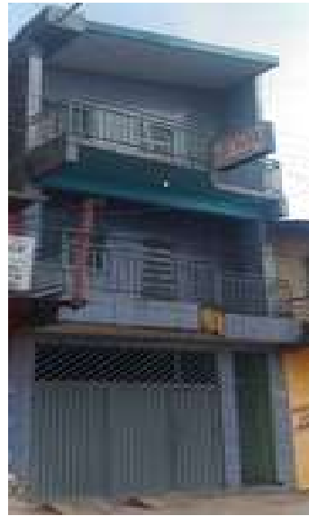
Figura 6: Hotel Santa Rita