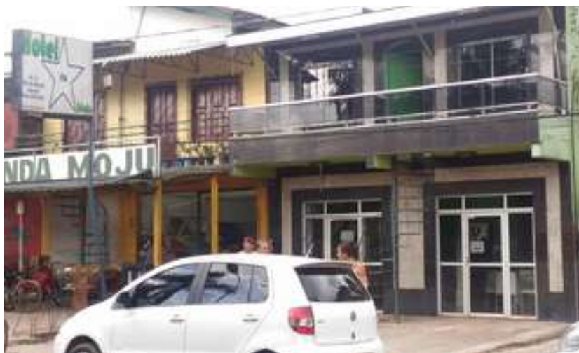
Figura 5: Hotel Estrela do Moju

Acessibilidade para pessoas com deficiência ou mobilidade reduzida: Não.