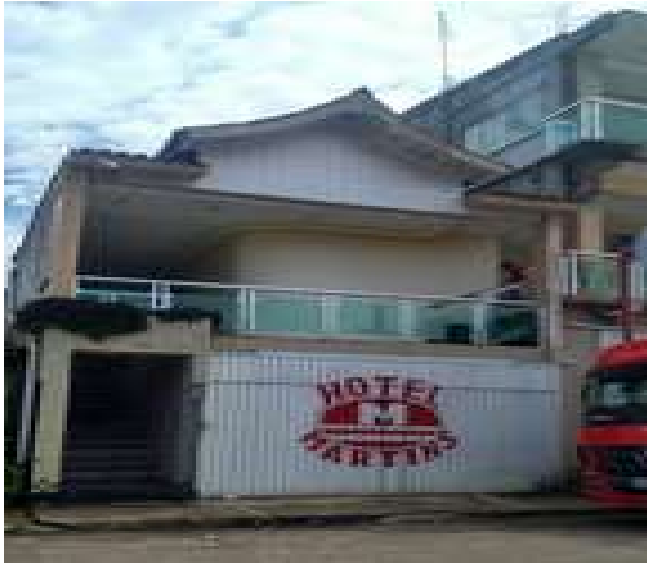
Figura 7: Hotel Martins

Acessibilidade para pessoas com deficiência ou mobilidade reduzida: Não.