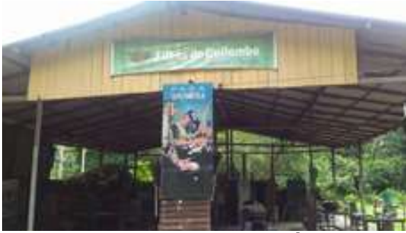
Figura 28: Comunidade África