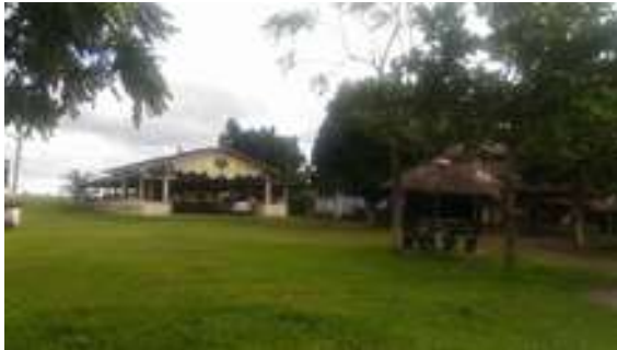
Figura 25: Balneário do Levi