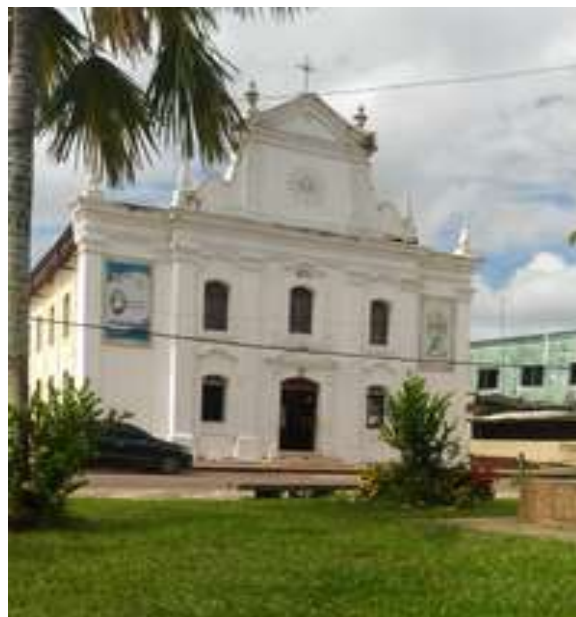
Figura 42: Paróquia do Divino Espírito Santo: Fachada