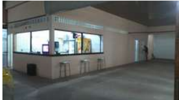
Figura 10: Restaurante e Pizzaria Marina Beach (Salão)