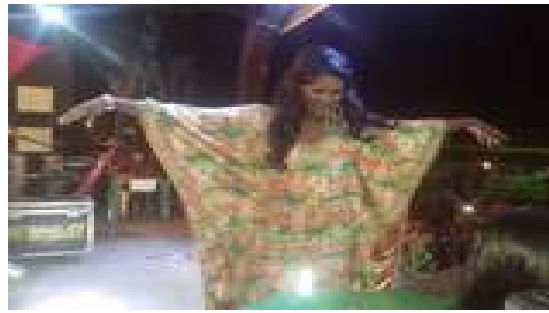
Figura 47: Verão 45° - Lual Gay