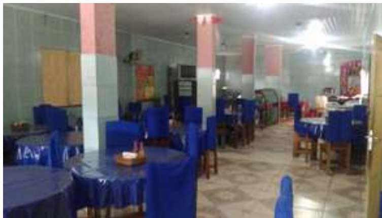
Figura 17: Restaurante Sabor Caseiro

Possui acessibilidade para pessoas com deficiência ou mobilidade reduzida: Não.