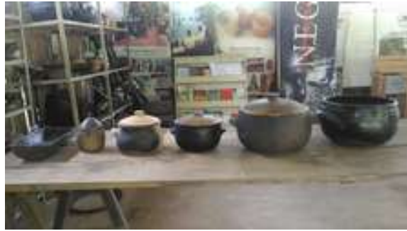
Figura 29: Comunidade África (Artesanato)