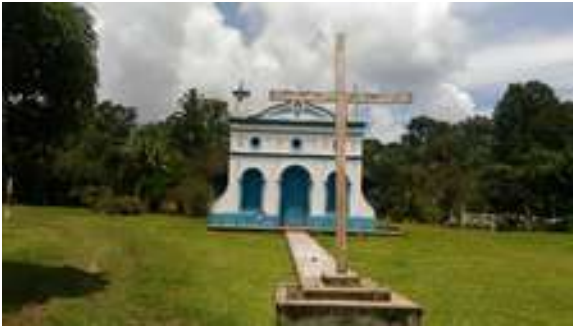
Figura 35: Igreja Santíssima Trindade

Atividades atuais: Cultural, Educativa, Comercial