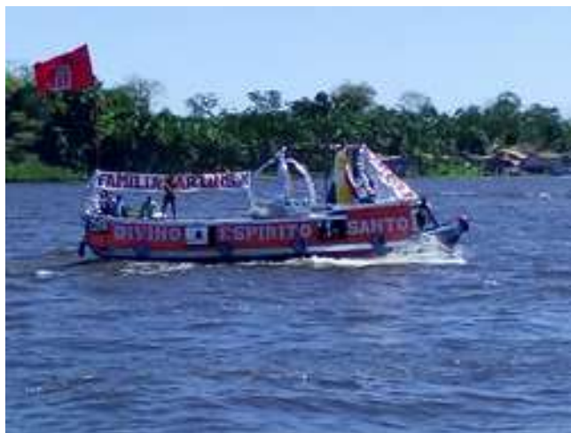
Figura 44: Festividade do Divino Espírito Santo (Círio Fluvial)