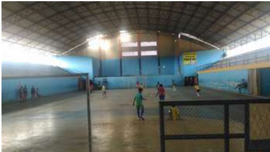
Figura 22: Ginásio Poliesportivo Iverson Pereira dos Santos “Preto”

Possui acessibilidade para pessoas com deficiência ou mobilidade reduzida: Não