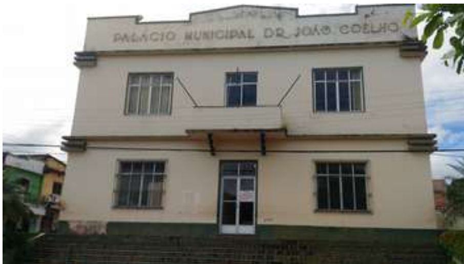
Figura 1: Prédio da Prefeitura Municipal de Moju

Nome do prefeito: Deodoro Pantoja da Rocha.