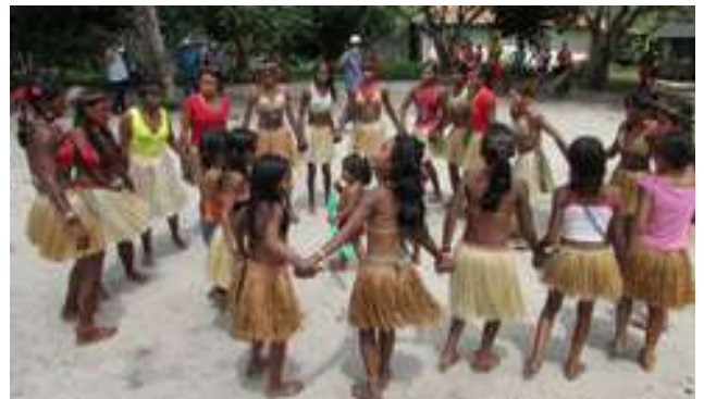
Figura 39: Tribo Anembé