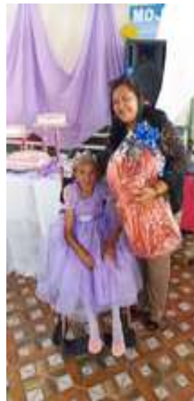
Figura 49: Verão 45° - Desfile das Coroas