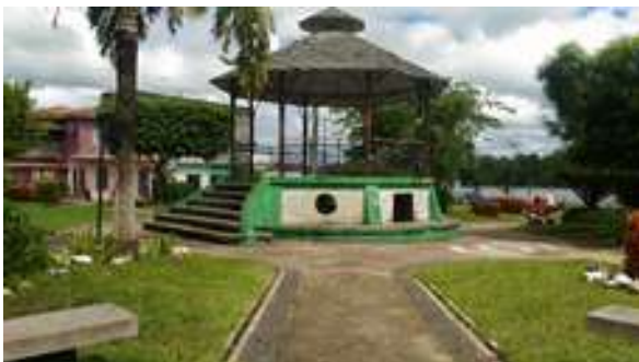
Figura 20: Praça Jarbas Passarinho: Coreto