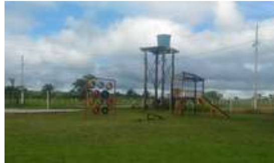
Figura 24: Balneário do Levi: Área Infantil