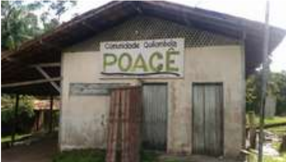
Figura 37: Comunidade Quilombola Poacê

Atividades atuais: Cultural, comercial e lazer.