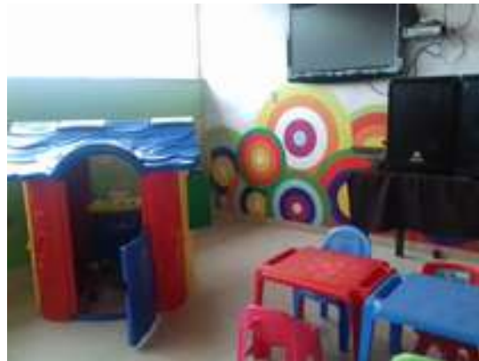
Figura 15: Moju Grill Churracaria (Área infantil)