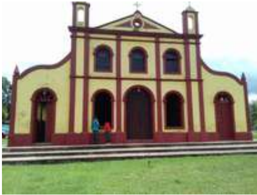
Figura 32: Igreja da Santíssima Trindade