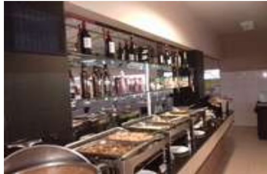
Figura 13: Moju Grill Churracaria (Buffet)