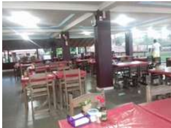
Figura 11: Restaurante Cantinho da Maria