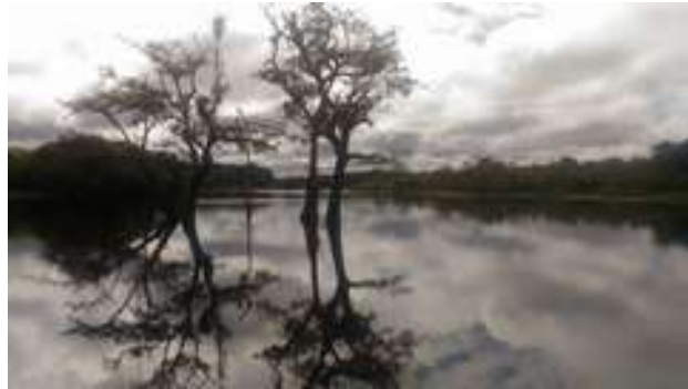
Figura 26: Balneário do Levi: Rio Ubá