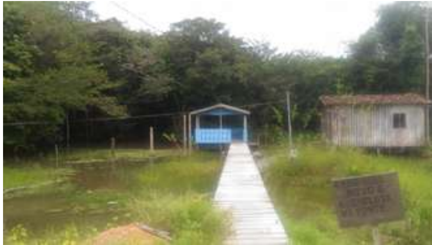
Figura 36: Rio Jambuaçu

Atividades atuais: Cultural, comercial e passeio.