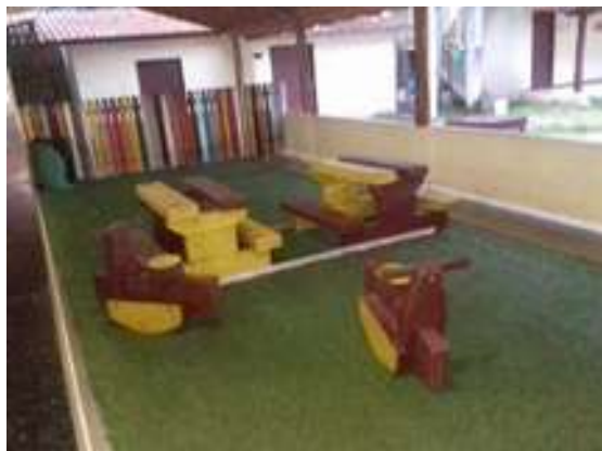
Figura 13: Restaurante Cantinho da Maria (Área infantil)