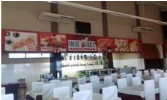
Figura 14: Moju Grill Churracaria