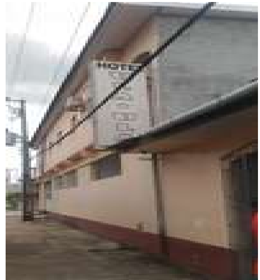
Figura 8: Hotel Ula Ula

Equipamentos e atividades de recreação e lazer: Não.