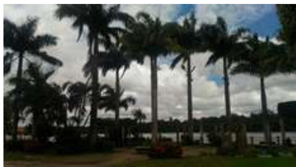
Figura 21: Praça Jarbas Passarinho: Paisagismo na Orla