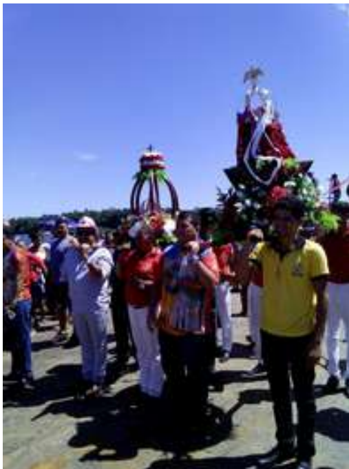
Figura 43: Festividade do Divino Espírito Santo

Mostrando a fé e a devoção do povo Católico devoto do Divino Espírito Santo também são marcantes durante a festividade o LEVANTAMENTO DO MASTRO E O AUTO DO DIVINO coordenado pela Secretaria de Cultura de Moju com belíssimas apresentações.