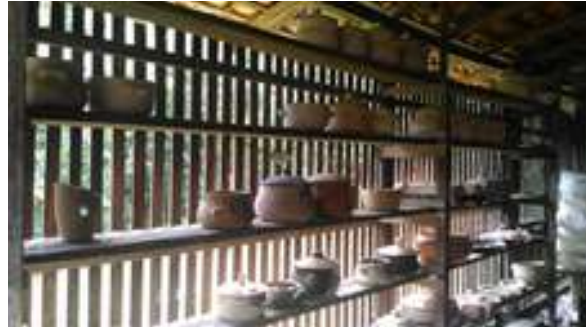
Figura 38: Comunidade Quilombola Poacê (Artesanato)