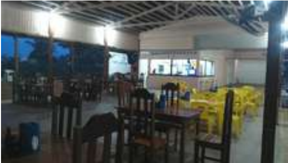
Figura 9: Restaurante e Pizzaria Marina Beach

Possui acessibilidade para pessoas com deficiência ou mobilidade reduzida: Não.